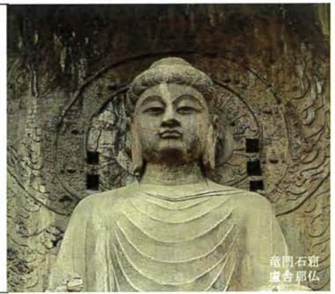
龍門石窟 盧舎那仏