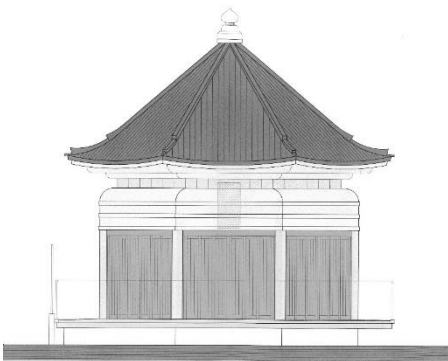
長泉寺「八角円堂（仮称）」新築デザイン原案図

今夏より建設が始まる「八角円堂（仮称）」建立予定地の境内墓地一角は、現在使用されている各家皆様よりご理解とご協力を得て、さらには無縁墳墓については官報に掲載し、順に整備をさせていただいております。本年五月（六月をめぐりに墓塔の移設を完了し、更地となる運びです。